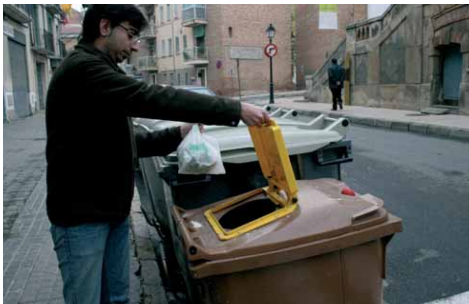
La recollida es porta a terme entre els veïns de Lleida, però també en l'àmbit de centres educatius, entitats i comerços.

Gairebé dos anys després que Lleida comencés a separar els residus orgànics amb la instal·lació de contenidors marrons a Pardinyes, la recollida de la fracció orgànica ja està implantada a tot el nucli urbà des de mitjan desembre de 2006.