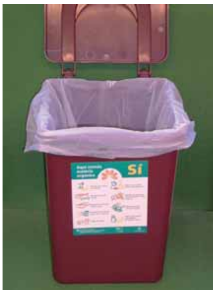
La Paeria ha repartit contenidors entre els domicilis.

Al març de 2005, Pardinyes va ser el primer barri on es va dur a terme la recollida de la brossa orgànica i el 15 de desembre de 2006 es van instal·lar els contenidors marrons a Magraners. Cada unitat familiar ha rebut un cubell on cal abocar el residu humit (restes de menjar, closques d'ou, restes del jardí i de plantes, etc.). Posteriorment, aquests materials s'han de recollir en bosses compostables (de midó o de paper), mai de plàstic, i es llencen als contenidors de color marró que hi ha situats al carrer.