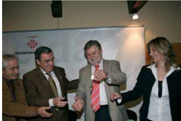
Acte de cessió dels tres locals destinats a l'escola d'art per part d'Adigsa.

L'escola d'art de Pardinyes forma part del Programa "Imagina: espais d'educació en l'art", que impulsa l'IME i té com a objectiu principal "integrar, vetllar i potenciar la millora de la qualitat de vida dels seus habitants". Al nou espai d'educació en l'art i la cultura visual es faran tallers i activitats relacionades amb l'art visual en horari