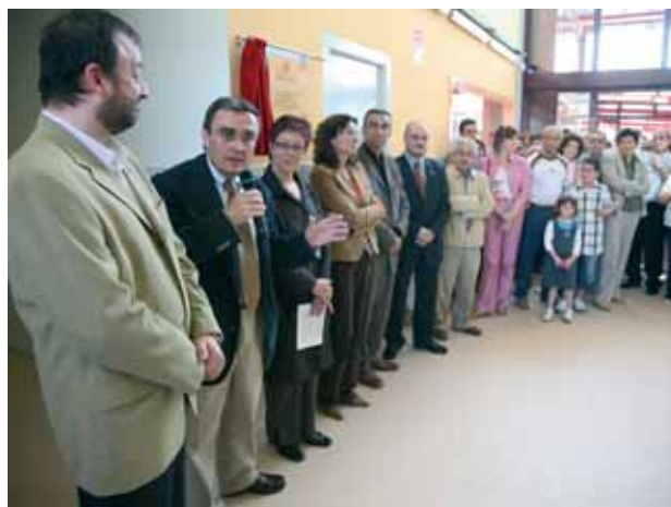
Inauguració del centre a càrrec de la consellera d'Ensenyament, Marta Cid.

La nova escola de la Bordeta iniciarà el pròxim curs amb dos grups de P3, un de P4 i un de P5. La capacitat total és per a uns 450 alumnes i el centre educatiu s'anirà omplint a mesura que els estudiants vagin pujant de curs. L'espai de l'edifici dedicat a l'ensenyament primari, que enguany encara no ofereix places,