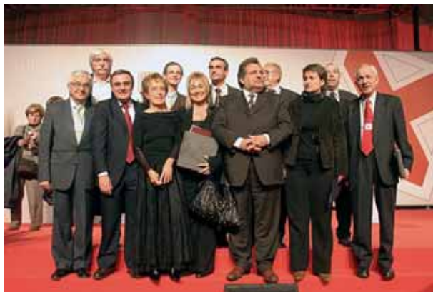
L'alcalde va acompanyar els guardonats de Lleida amb la Creu de Sant Jordi.