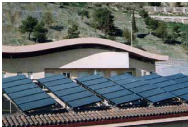
Plaques solars instal·lades als habitatges de protecció oficial de La Parra.

El grup preveu recollir tota la informació necessària per determinar el consum energètic de la ciutat, tant de particulars com d'empreses, indústries i serveis. La Paeria espera disposar d'aquestes dades al mes de juny, de manera que el Pla Energètic de Lleida pugui aprovar-se en el primer trimestre del 2007.