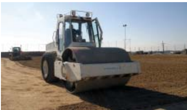
El camp de futbol de l'AEM disposarà de gespa artificial

Per la seva banda, el Consell Català de l'Esport assenyala la intenció d'incorporar una subvenció