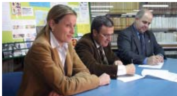
El conveni signat preveu convocar una plaça de becari.

L'Ajuntament de Lleida i el Col·legi Episcopal han signat un acord de col·laboració que permet el manteniment i l'actualització de la cartellera informativa del Centre d'Informació Juvenil al centre. El col·legi convoca una plaça de becari entre els seus alumnes, amb la finalitat que es faci càrrec del manteniment i de l'actualització de la cartellera.