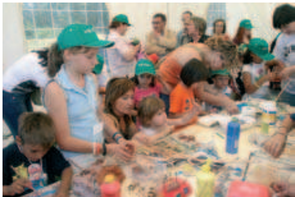
Unes 2.000 persones es van congregar al Parc de la Mitjana.

El Parc de la Mitjana va acollir la segona edició de la Festa del Medi Ambient, organitzada per la Regidoria de Sostenibilitat i Medi Ambient de l'Ajuntament de Lleida, amb motiu del Dia