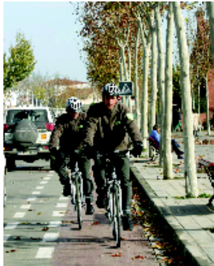
La Brigada de Medi Ambient en acció.

De totes aquestes actuacions, el 76% es van fer al nucli urbà de Lleida, el 19% a l'Horta de Lleida i el 5% als polígons. La Brigada va recollir 31 denúncies, la major part de les quals sobre l'enganxada de cartells en indrets públics, i va fer 22 requeriments sobre abocadors, brutícia als solars i problemes concrets a la xarxa hidrogràfica.