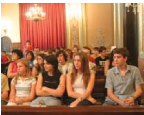
Imatge de l'últim Ple dels Infants celebrat a Lleida.

La ciutat de Lleida ha rebut la distinció de Ciutat Amiga de la Infància que concedeixen conjuntament la UNICEF, el Ministeri de Treball i Assumptes Socials, la Federació Española de Municipios y Provincias (FEMP) i la Xarxa Local a Favor dels Drets de la Infància i l'Adolescència. Aquestes institucions han volgut mostrar així el reconeixement al treball que l'Ajuntament de Lleida, amb el suport de tota la ciutadania, ha portat a terme en el seu compromís amb els drets dels infants i la seva participació en la vida pública del municipi.