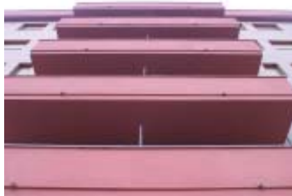
L'oficina promourà 300 pisos de lloguer.

L'Ajuntament de Lleida ha acordat crear una Oficina Local d'Habitatge, que estarà coordinada per l'Empresa Municipal d'Urbanisme i tindrà com a primer objectiu fixar el mapa de solars on es construiran pisos de lloguer i pisos de protecció oficial.