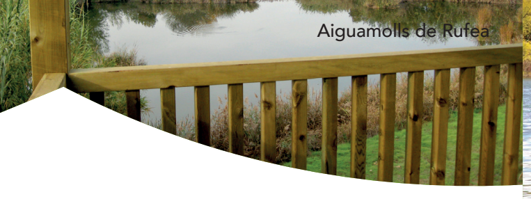
Aiguamolls de Rufeia