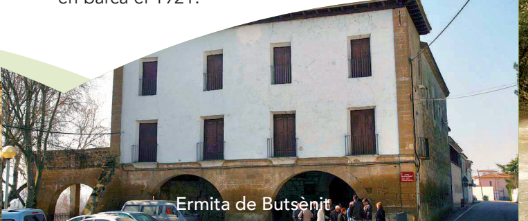
Ermita de Butsènit