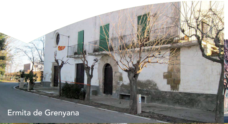
Ermita de Grenyana

L'edifici actual és un temple alçat durant els segles XVII i XVIII, en substitució de l'anterior santuari medieval, que va ser destruït amb els diferents conflictes bèl·lics que va patir la ciutat durant aquells segles.