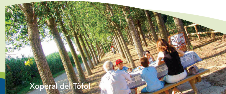
Xoperal del Tòfol

L'ermita de Butsènit apareix esmentada al segle XIV com un important santuari de la ciutat dedicat a una marededéu trobada. Avui continua sent el centre neuràlgic i de trobada dels veïns de les hortes fluvials de Rufeia i Butsènit. Durant la guerra dels Segadors va ser molt malmesa i al segle XVIII es va alçar de nou. Ha estat restaurada i decorada amb murals de Víctor P. Pallarès i també acull una escultura de Josep Torrelles que duu per títol "Flumen", un monument en record de les 33 víctimes que es van ofegar al riu mentre el travessaven en barca el 1921.