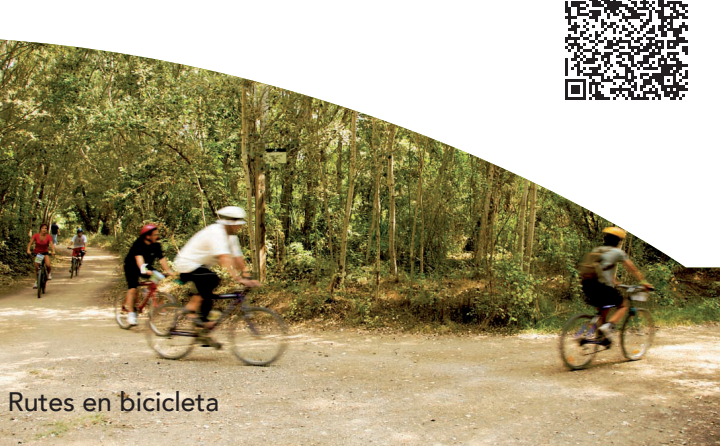
Rutes en bicicleta

En un mosaic on conviuen l'aigua, els boscos i l'horta, Lleida compta amb més de 500 km de camins d'horta per passejar o anar en bicicleta. Hi ha una dotzena de rutes senyalitzades per la pràctica lliure de la bicicleta que es poden consultar a: https://urbanisme.paeria.cat/copy_of_serveis%0Durbans/horta/rutes-cicloturistiques%0Ddel-municipi-de-lleida