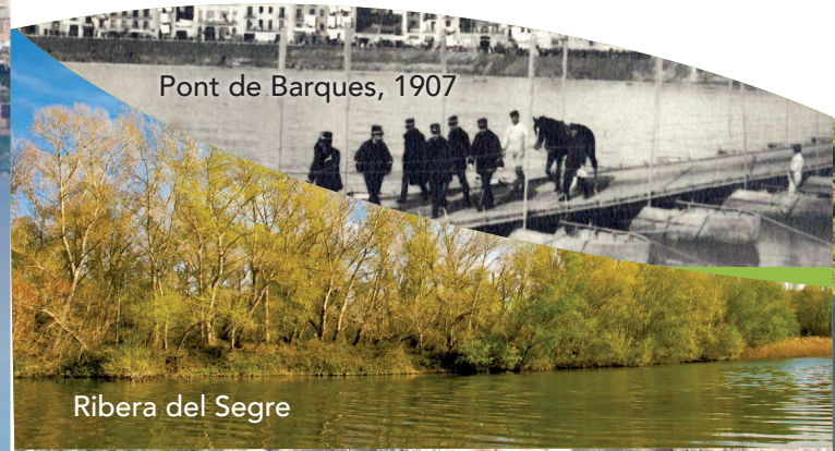
Pont de Barques, 1907