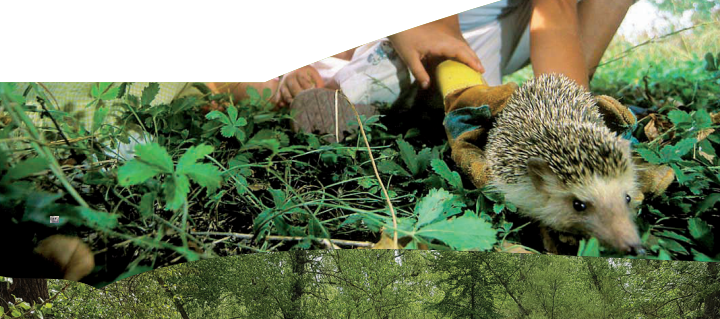
Activitats al Centre d'Interpretació de la Mitjana

El Centre d'Interpretació de la Mitjana compta amb una exposició permanent sobre el parc, un audiovisual de gran format, un laboratori, un observatori d'ocells... En definitiva, un conjunt d'eines i recursos per ajudar a descobrir i entendre el funcionament ecològic d'aquest espai natural i la relació entre les seves espècies.