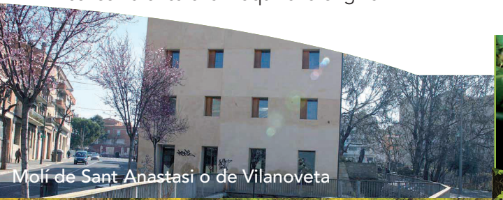
Molí de Sant Anastasi o de Vilanoveta

Antic molí fariner que s'abastia de la sèquia de Fontanet, constitueix el darrer vestigi de l'antic poble de Vilanova de Fontanet o de l'Horta, que se situaria a l'actual barri de la Bordeta. Consta de dependències annexes que servien de graner i habitatge de les persones encarregades del molí. És una de les seus del Museu de l'Aigua de Lleida i conserva encara la maquinària original.