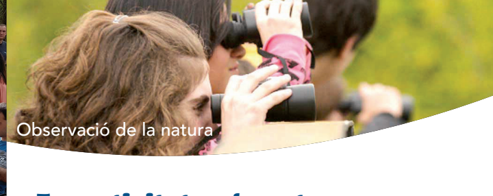
Observació de la natura