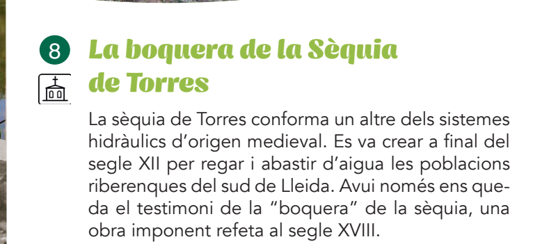
Boquera de la Sèquia de Torres