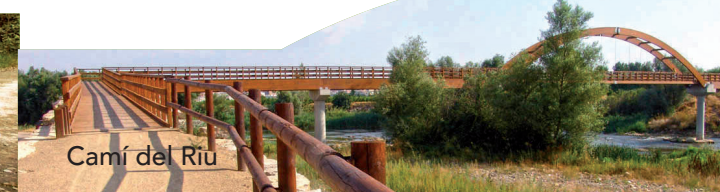
Camí del Riu

La llarga ruta cultural del Camí de Sant Jaume, travessa Lleida, on, segons la tradició, l'apòstol Sant Jaume es va aturar a predicar. Començant al Cap de Creus, el recorregut passa pel monestir de Montserrat i arriba a Lleida per la Mitjana, des d'on ressegueix el riu fins que es desvia cap a Alcarràs, a l'alçada de Butsènit, i continua cap a Aragó. En el tram entre Lleida i Acoletge, hi ha un traçat alternatiu, que segueix el riu Segre i és l'utilitzat per dues rutes cicloturístiques, la Inter-Catalunya (Lleida-Girona) i la ruta dels llacs (Lleida-La Pobla de Segur).