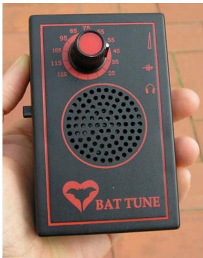
Foto 1.- Detector heterodí Bat Tune , versió 2.

Per aplicar el protocol només cal un termòmetre, un detector heterodí ( Foto 1 ), un lot i quelcom per anotar les dades (model de fitxa a l'Annex 1). Els col·laboradors d'aquest seguiment poden obtenir el detector Bat Tune a baix cost.