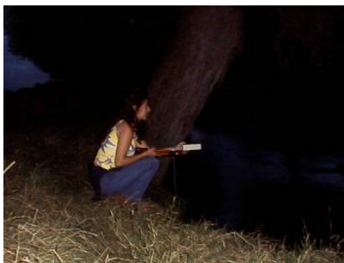
Foto 2.- Exemple de posició en que s'ha de realitzar l'estació. Amb el detector en una mà i la llanterna en l'altre.