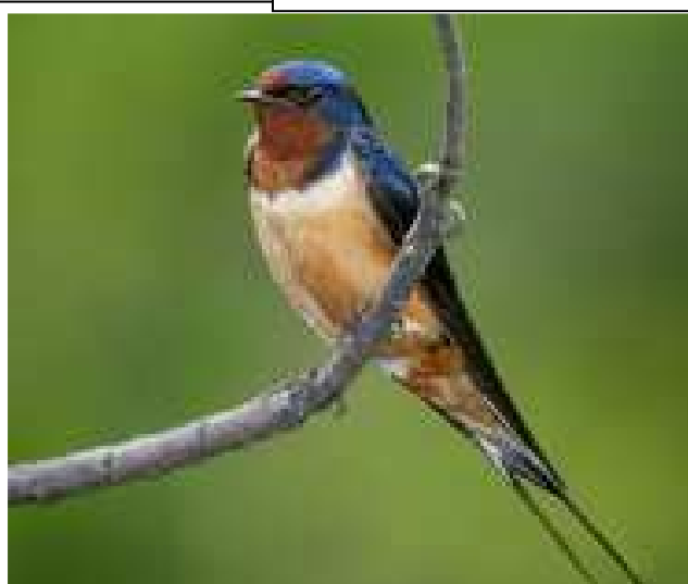
Orenetes vulgar ( Hirundo rustica )

L'orenetes vulgar es diferencia de la cuablanca perquè la primera té la cua més llarga i la gorja d'un color grana, mentre que l'altra té una cua més curta i la gorja i el carpó blancs. Si teniu la sort que elegeixen casa vostra per fer-hi el niu, respecteu-les, així podrem seguir gaudint-ne molts anys més.