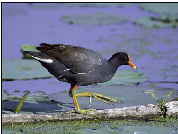
Gallineta d'aigua. Adult

Posa de 4 a 8 ous, que són incubats durant aproximadament tres setmanes. Ambdós pares incuben i alimenten els polls.