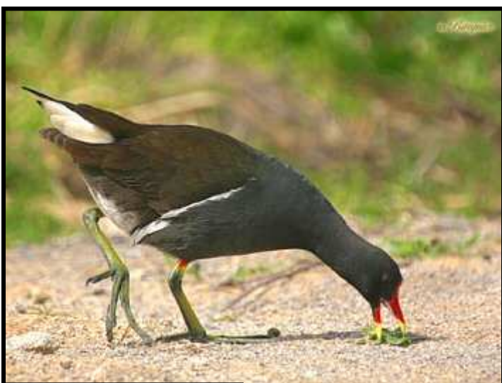
Gallineta d'aigua. Adult