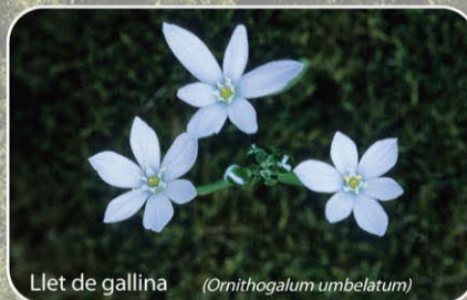
Llet de gallina ( Ornithogalum umbellatum )