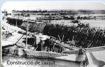
Construcció de l'assut

L'any 1985 l'Ajuntament de Lleida inicià el projecte de recuperació i gestió de l'ecosistema, compatibilitzant-lo amb l'ús ciutadà.