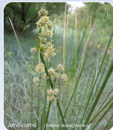
Jonc comú ( Scirpus holoschoenus )

-El bosc de ribera, amb un sòl fèrtil d'elevada disponibilitat d'aigua, i amb llum i visibilitat escasses