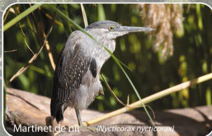
Martinet de nit ( Nycticorax nycticorax )

A cada estació de l'any, el paisatge de la Mitjana canvia de forma sorprenent. A la tardor, els arbres i arbusts (pràcticament tots caducifolis) es tenyeixen de grocs i vermells i comencen a perdre les fulles, preparant-se pel fred. Les boires i el gel de l'hivern, donen al parc un aspecte de calma i repòs. Al riu, apareixen les siluetes dels ocells que han triat la Mitjana per passar l'hivern. De tant en tant, un raig de sol s'esmuny entre les capçades despullades i il·lumina el bosc anunciant la primavera. I aleshores, a poc a poc, allarga el dia, els ocells hivernants marxen i deixen lloc als que arriben pel bon temps. La vegetació floreix i verdeja amb força i així, quan arriba l'estiu, el parc ja és un agradable espai ombrívol a la vora del riu.