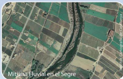
Mitjana Fluvial en el Segre

Les mitjanes, són illes típiques dels cursos baixos dels rius. L'espai natural de "El parc de La Mitjana" s'ubica sobre aquestes formacions fluvials, estabilitzades per un petit assut aigües amunt de la ciutat de Lleida.