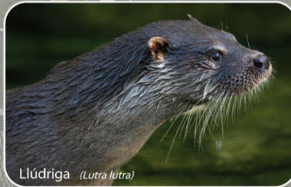
Llúdriga ( Lutra lutra )