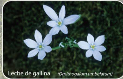
Leche de gallina ( Ornithogalum umbellatum )