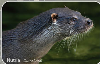
Nutria ( Lutra lutra )