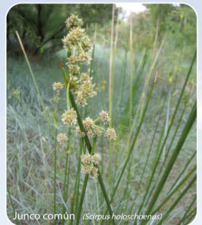
Junco común ( Scirpus holoschoenus )

-El bosque de ribera, con un suelo fértil de elevada disponibilidad de agua, y con una luz y visibilidad escasas