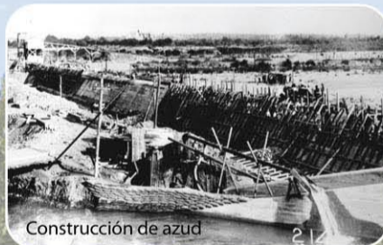
Construcción de azud

En 1985 el Ayuntamiento de Lleida inició un proyecto de recuperación y gestión del ecosistema, compatibilizándolo con el uso ciudadano.