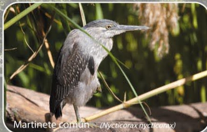
Martinete común ( Nycticorax nycticorax )

Las nieblas y escarchas del invierno dan al parque un aspecto de calma y reposo. En el río, aparecen las siluetas de los pájaros que han venido a la Mitjana a pasar el invierno. Ocasionalmente un rayo de sol se filtra entre las copas desnudas e ilumina el bosque anunciando la primavera y entonces, poco a poco, se alarga el día, los pájaros invernantes emigran y dejan sitio a los que llegan con el buen tiempo. La vegetación florece y verdea con fuerza y así, cuando llega el verano, el parque se convierte en un refugio sombreado al lado del río.