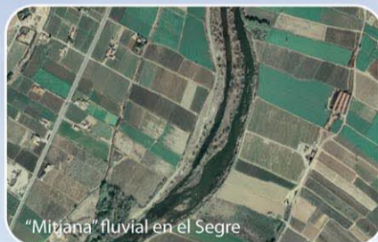
"Mitjana" fluvial en el Segre

Las "mitjanes" o mejanas son islas típicas de los cursos bajos de los ríos. El espacio natural del "Parque de la Mitjana" se ubica sobre formaciones fluviales, estabilizadas por un pequeño azud aguas arriba de la ciudad de Lleida.