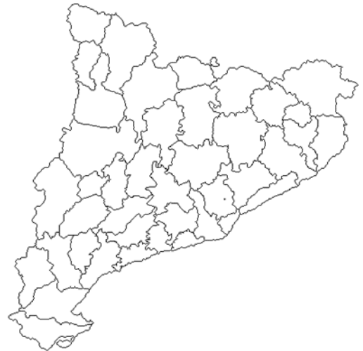
Opció 2: mapa