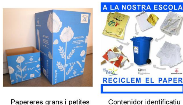
Papereres grans i petites