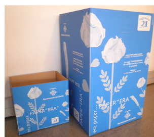
Papereres grans i petites