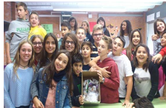
Institut Torre Vicens