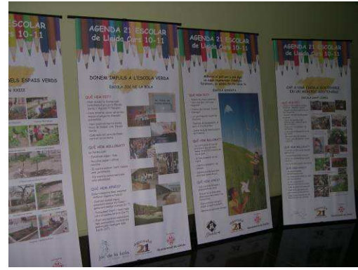
Mural d'objectes i exposició de pòsters