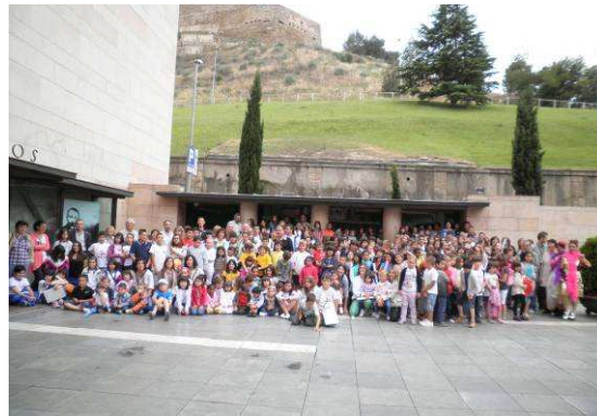
Foto de família a l'exterior de l'Auditori