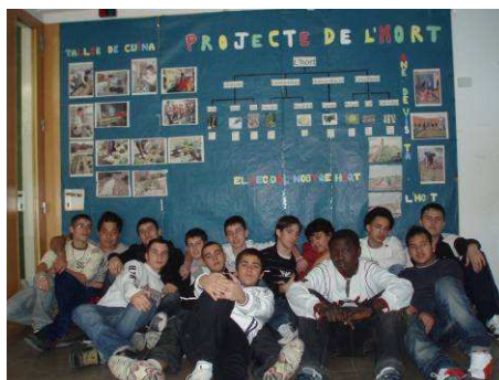
Alumnes de l'Aula Oberta de l'IES Maria Rúbies