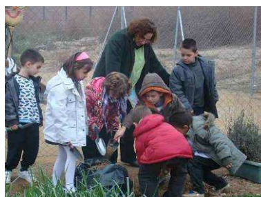
Agafant terra de l'hort