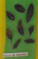
FOLIA DE ALNUS