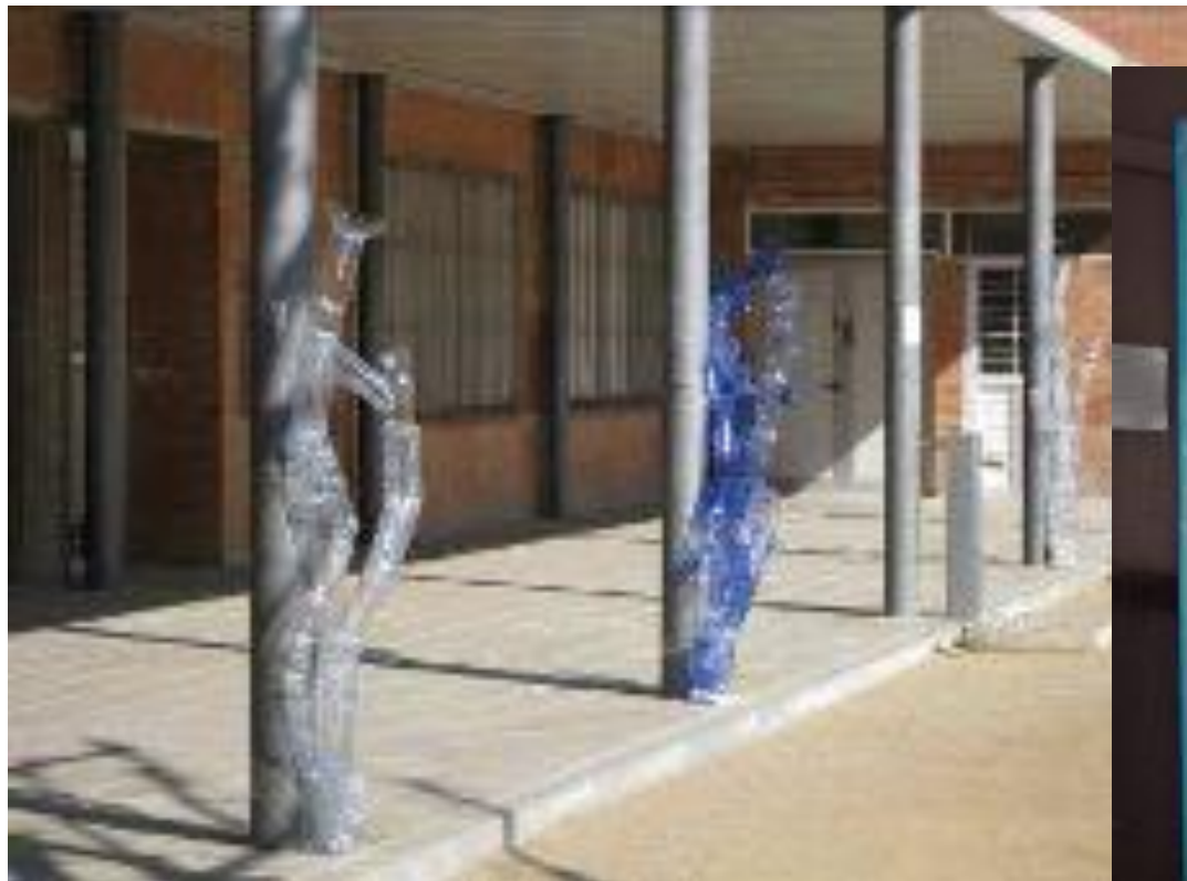
Institut Josep Lladonosa