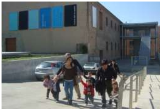
Vista al centre d'art contemporani de la Panera. Exposició de Ignacio Uriarte ens inspira per poder fer un túnel pel nostre pati.