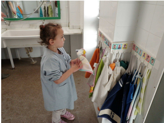
Escola Enric Farreny