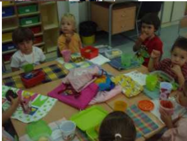
Escola Països Catalans