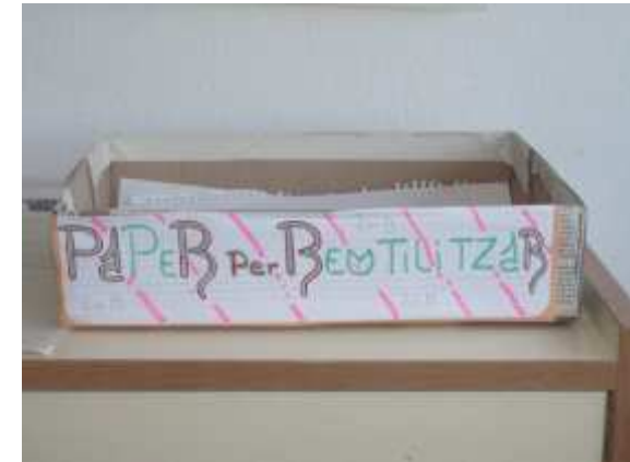
Institut M a Rúbies