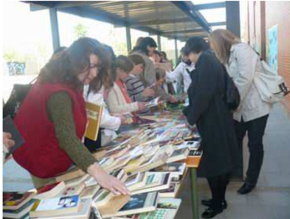
Mercat d'intercanvi de llibres per la diada de Sant Jordi Col·legi Sant Jordi

Altres propostes... MERCATS D'INTERCANVI