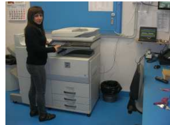
Institut Samuel Gili i Gaya