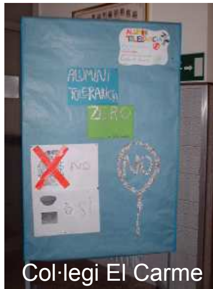
Col·legi El Carme