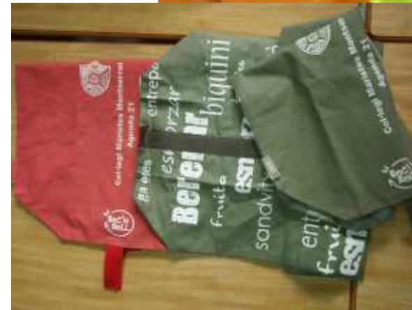
Col·legi Maristes Montserrat