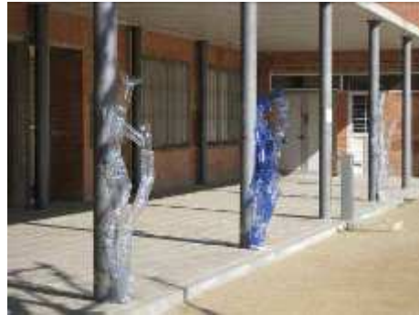
Institut Josep Lladonosa