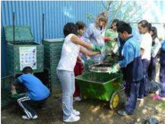
Escola Camps Elisis