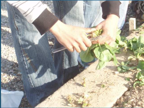
Tallant els espinacs