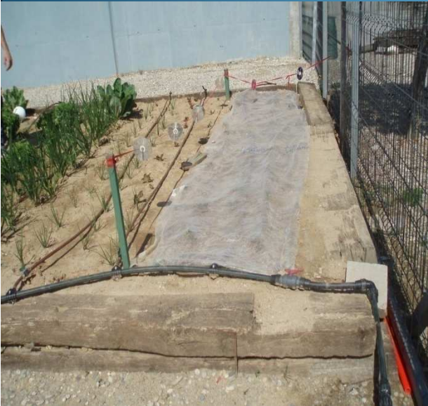
Coberta amb agrotèxtil