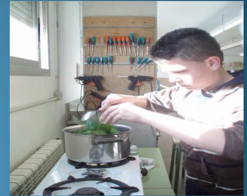
Bullint els espinacs