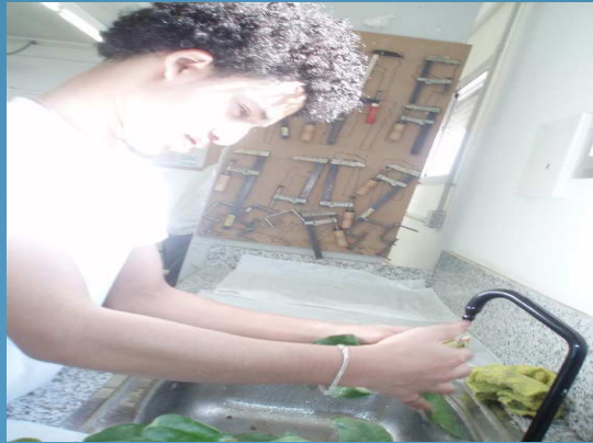
Rentant els espinacs