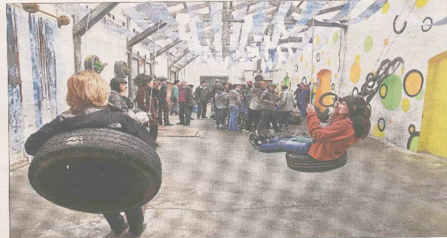
Els alumnes de l'Escola Ondara de Tàrraga van presentar ahir el fruit de la seua acció artística.