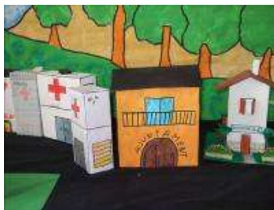
“Construïm edificis reutilitzant brics i cartró” (Col El Carme)