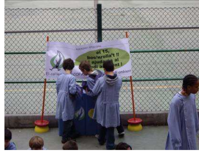
“El dia 15, boc'nrollat. Els alumnes d'ESO van ser els encarregats de distribuir els boc'n per les classes dels petits”.