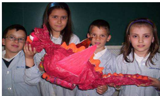
“Els alumnes de cicle mitjà hem aprofitat materials per fer titelles” (Col Anunciata)