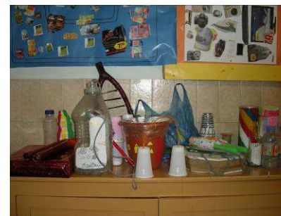
“Fem instruments musicals i una baldufa a partir de materials per reciclar” (Col Sagrada Família)