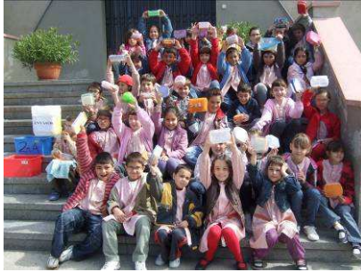
“Utilitzem la carmanyola per portar l’esmorzar”.