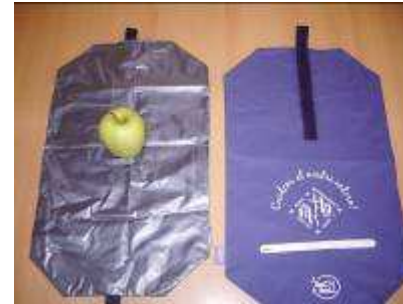
“El nostre embolcall per l’esmorzar permet la reducció de residus, es pot netejar i és personalitzat!” (Esc Pràctiques I)