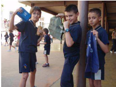
“Superherois de la reducció i el reciclatge”. (Col. Maristes)