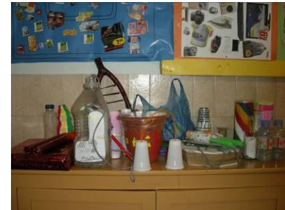
“Fem instruments musicals i una baldufa a partir de materials per reciclar” (Col Sagrada Família)