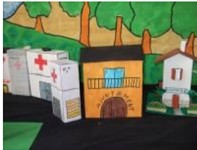
“Construïm edificis reutilitzant brics i cartró” (Col El Carme)