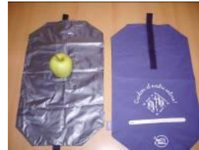
“El nostre embolcall per l’esmorzar permet la reducció de residus, es pot netejar i és personalitzat!”