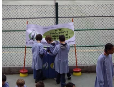
“El dia 15, boc’nrollat. Els alumnes d’ESO van ser els encarregats de distribuir els boc’n per les classes dels petits”.