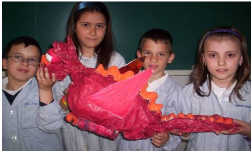
“Els alumnes de cicle mitjà hem aprofitat materials per fer titelles” (Col Anunciata)