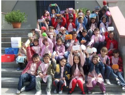
“Utilitzem la carmanyola per portar l’esmorzar”. (Col. El Carme)