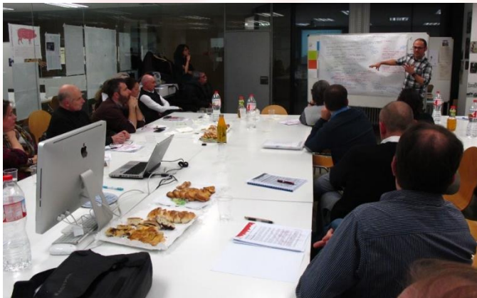
Fotografia 2. Posada en comú dels resultats del subtema 2.

Una variant dels grafitis són les firmes o "tags", que segons els participants no signifiquen cap aportació artística o estètica, sinó tot el contrari. Caldria poder denunciar i sancionar les persones que efectuen aquestes pintades, tot i que els mateixos participants van coincidir en la dificultat d'enxampar les persones que fan "tags" in fraganti .