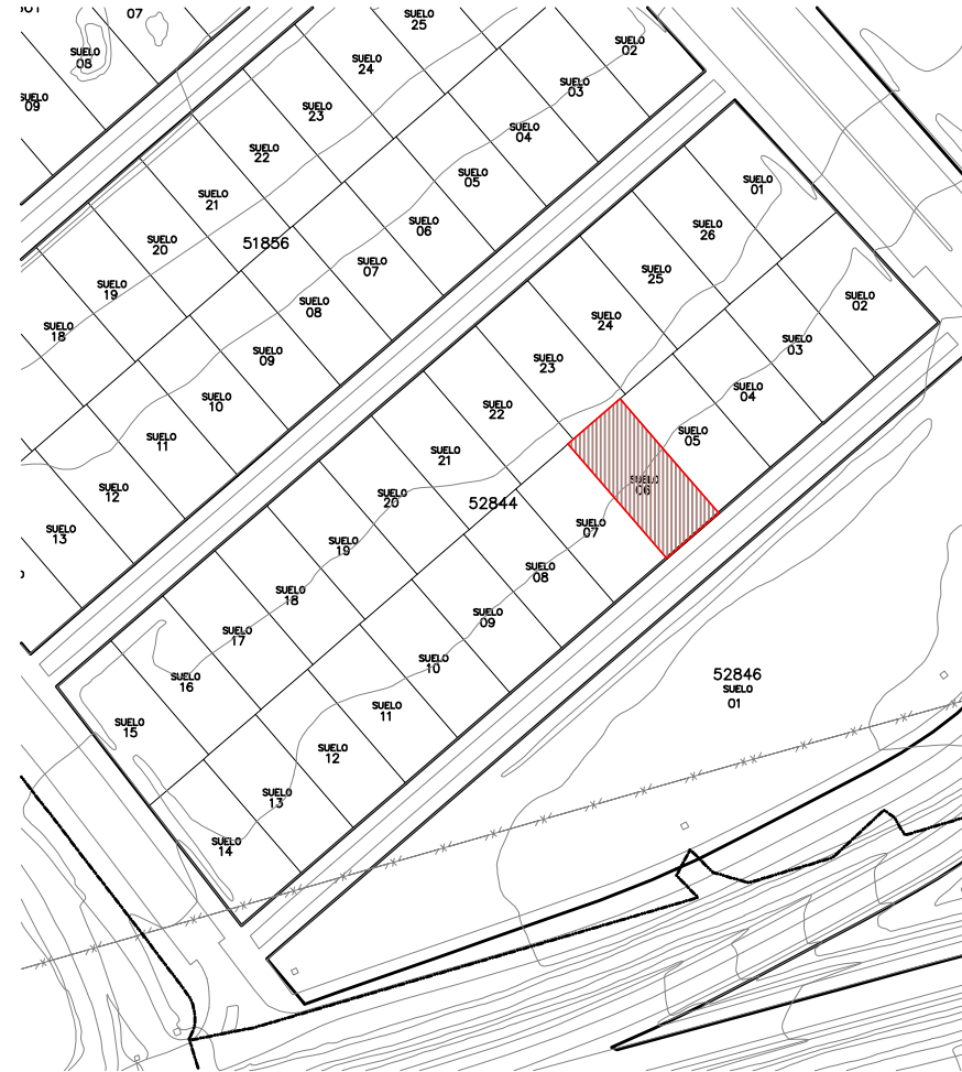
CADASTRE e: 1/2.000