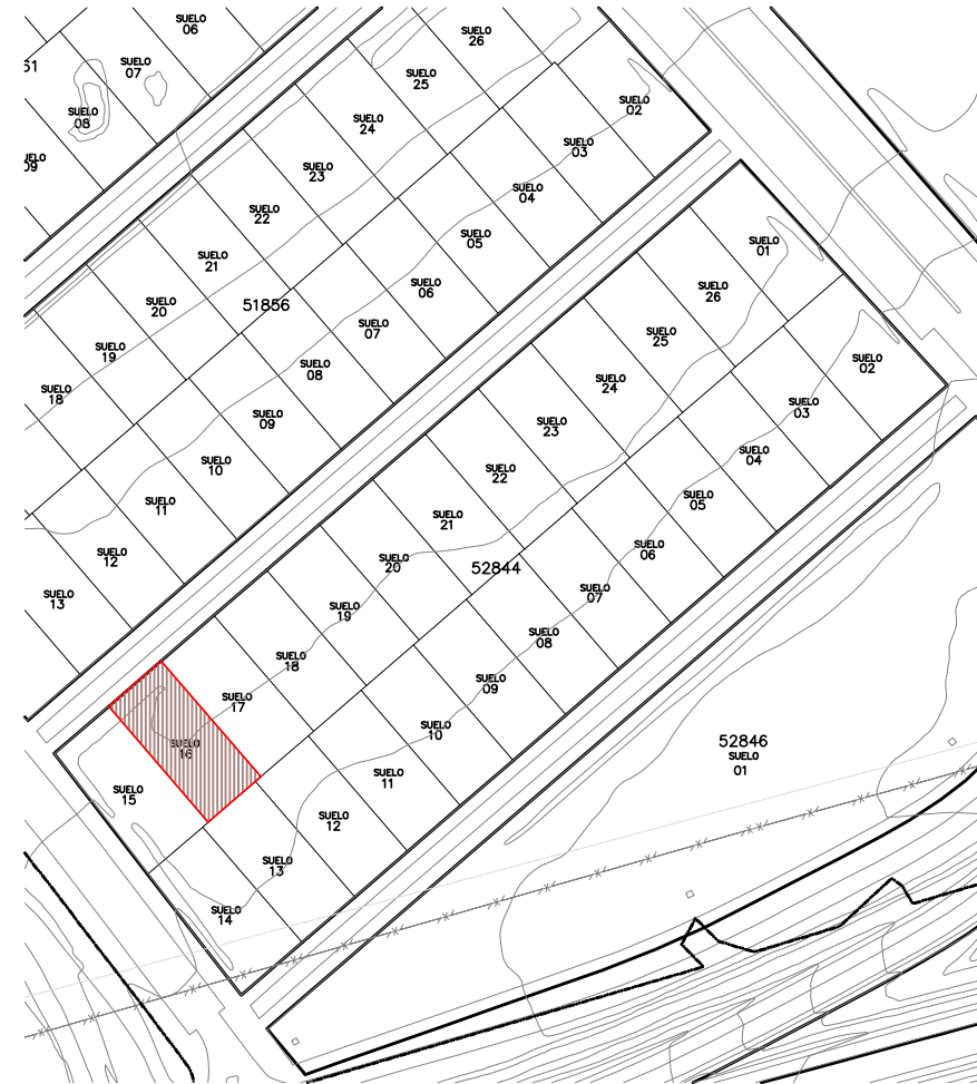
CADASTRE e: 1/2.000