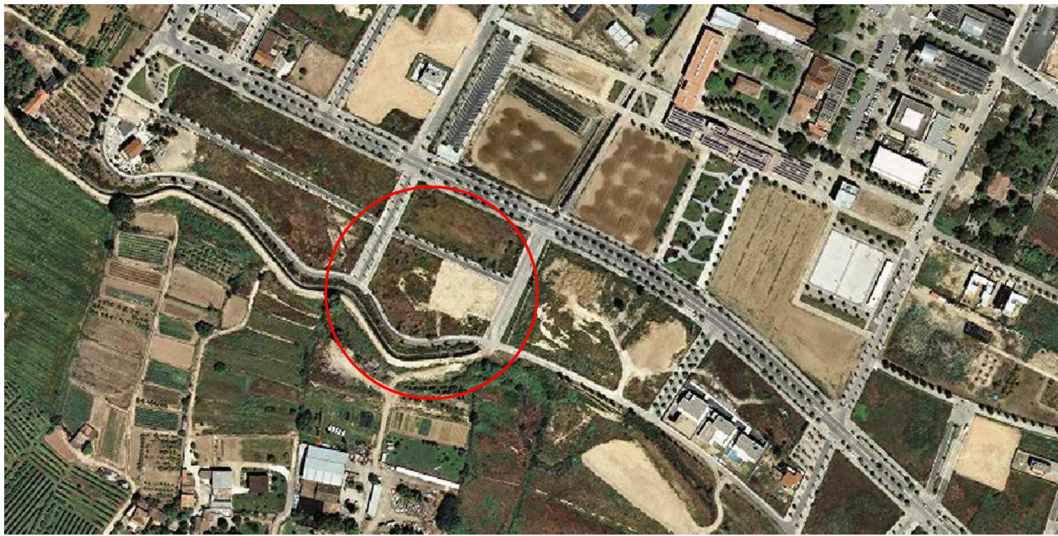
ORTOFOTO e: 1/4.000