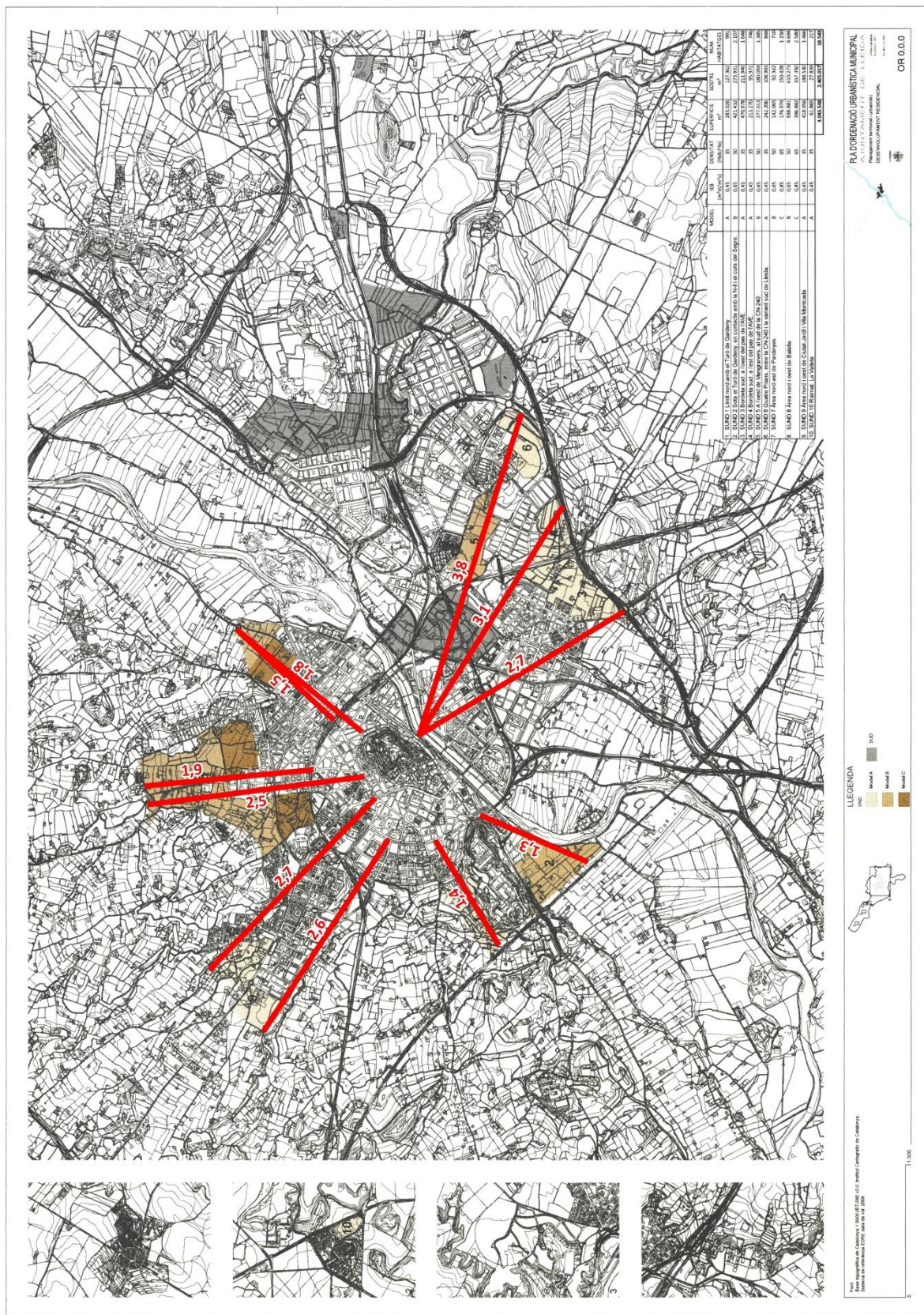
Mapa 2 – Distància màxima dels sectors SNUD al primer cinyell i segon cinyells de circumval·lació de la ciutat.